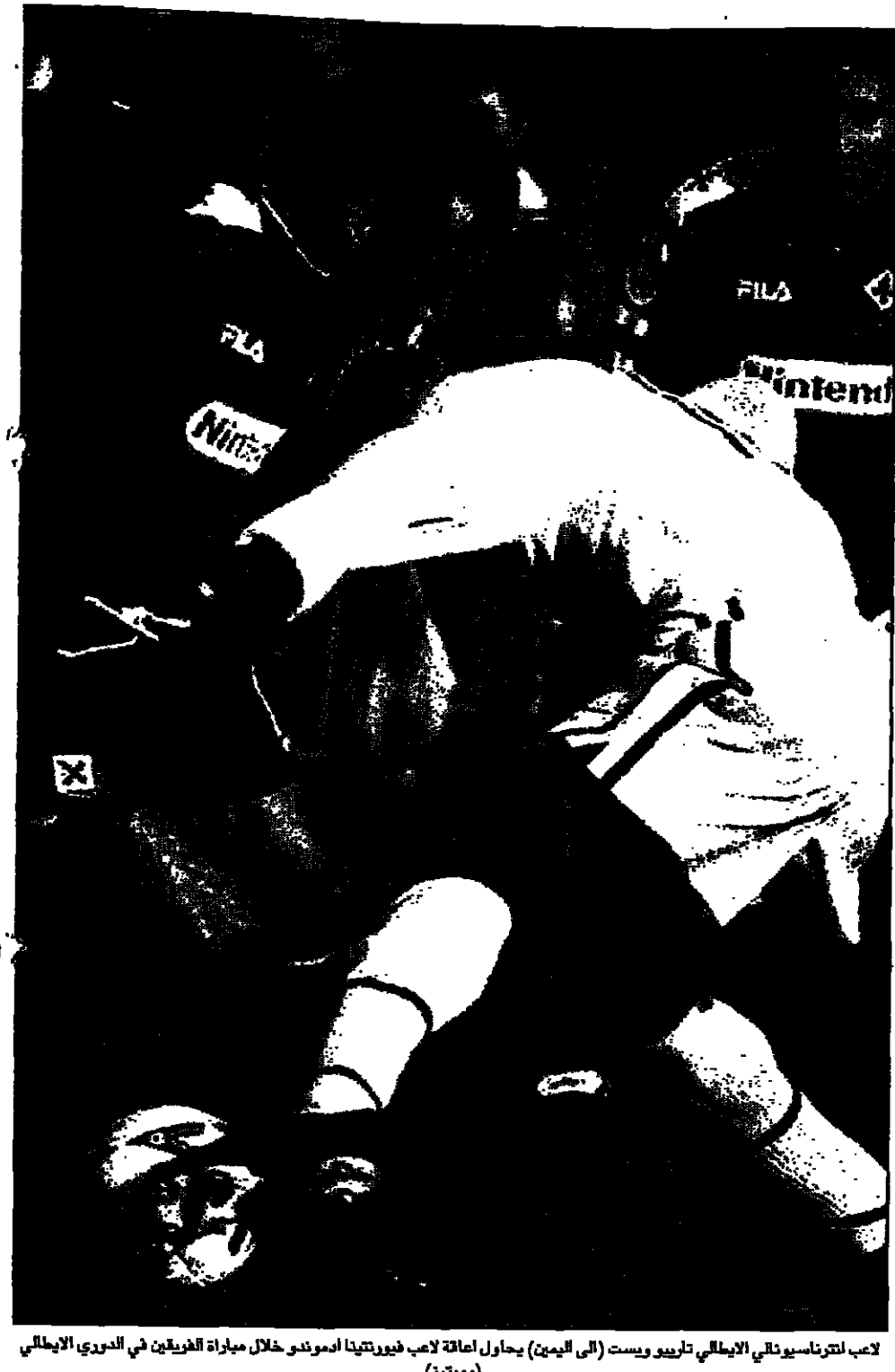
لاعب لاتفيا يذبح في المباراة بين الفريقين في الدوري الإيطالي